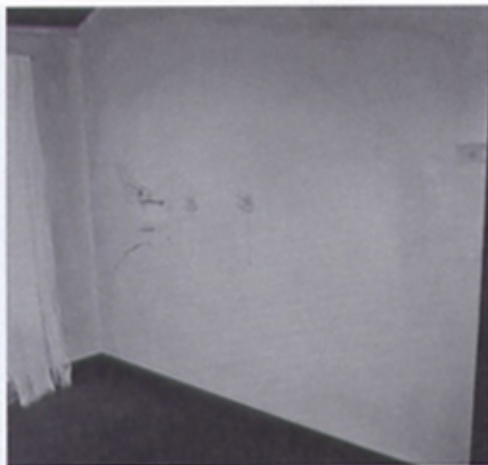
皮特里瑟 (Catalin Petrisor) 〈遊戲間〉 (Playroom) 油彩、石墨、畫布 144×150cm 2012