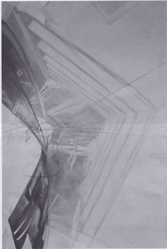
皮特里瑟 (Catalin Petrisor) 〈她的預言〉 (Herself divine) 油彩、石墨、畫布 90×60cm 2012

事情的重要性。這樣一來繪畫讓我可以同時到達兩個地方，在這裡、此時以及驚奇的領域。」